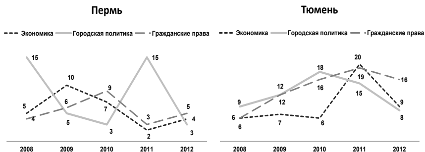
Рисунок 2. Динамика основных протестных требований в Тюмени (слева) и Перми (справа) за 2008–2012 гг.

решениями городских властей, до политических организаций и гражданских активистов. Наконец, по поводу гражданских и политических прав в Тюмени чаще организовывали акции анархисты, РКРП и партия «Воля», а в Перми – гражданские активисты и КСПД. Тема экономического кризиса как в Тюмени, так и в Перми звучит в акциях коммунистических организаций. Пермский КСПД в рамках кампании против расселения общежитий поднимает тему кризиса на митинге 25 октября 2008 г., в 2009 г. проводит три акции (15 февраля, 14 марта, 17 октября). Протестные требования фокусируются на бедственном положении незащищенных социальных групп: рабочих («Рабочие не должны платить за кризис!», «Нет сокращениям!»), жителей расселяемых общежитий («Россия – страна бездомных», «Власть делает нас бомжами»), пенсионеров и малоимущих («Народ против роста цен»). Адресатом требований стали губернатор края Олег Чиркунов, «Единая Россия» и «власть» в целом.