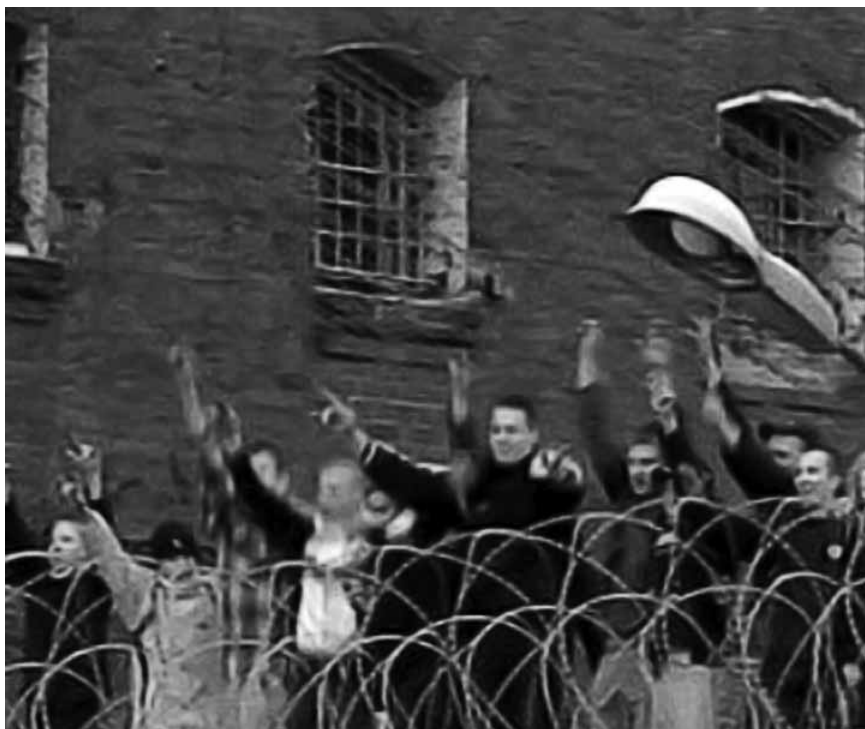
Ил. 2. Бунтующие подростки в следственном изоляторе «Кресты».

Чайка назвал такую ситуацию недопустимой. Юрий Чайка, генеральный прокурор РФ: «Следственный изолятор один из худших, наверное, в Российской Федерации, хотя расположен в Московской области. Условия, в которых содержатся люди, не выдерживают никакой критики. Если, в среднем, у нас по Российской Федерации 4,1 квадратных метра на человека, то в этом следственном изоляторе 2,6 квадратных метра на человека, а в некоторых камерах, вы видели, чуть больше одного квадратного метра на человека. Причем это женщины. Мне, по сути, жалко работников, администрацию следственного изолятора, которые, по сути, отбывают в таких плохих условиях то же наказание [Генеральный... 2008].