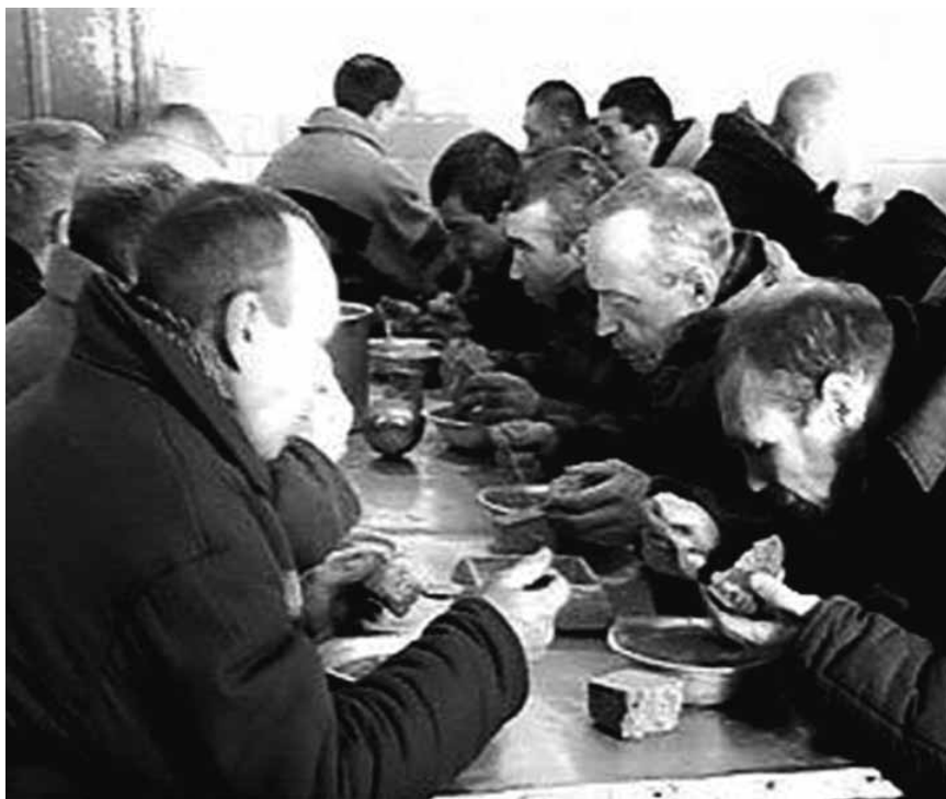
Ил. 3. Заключенные в столовой колонии.

В целом независимо от содержания репортажей, которые могут проблематизировать условия содержания заключенных или, что встречается чаще, описывать попытки тюремных властей приблизить эти условия к жизни за пределами СИЗО и колоний, в новостях Первого канала преобладают традиционные речевые обороты, сами по себе отделяющие заключенных от остальной части общества: «массивные железные двери, решетки и замки», «под конвоем» или «под присмотром конвоя», «за решеткой», «за колючей проволокой», «спецконтингент», «за периметром» и так далее, а также визуальные образы, символизирующие опасность и угрозу, исходящую от заключенных.