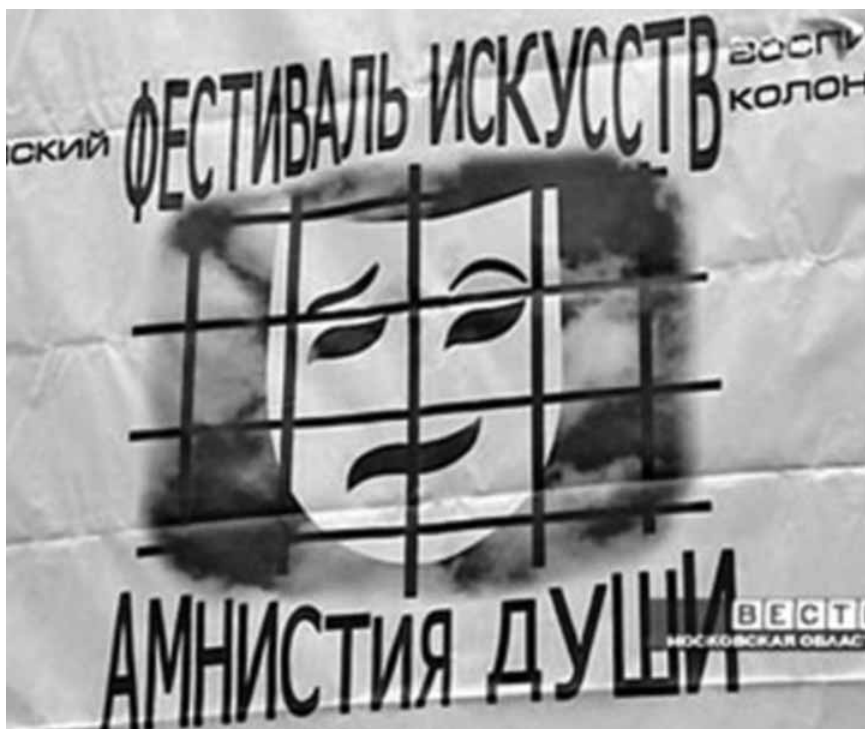
Ил. 5. Символ фестиваля «Амнистия души».

ющим образом: «Сегодня этот молодежный театр начинался не с вешалки, а с рамки металлоискателя (в видеофрагменте — зрители проходят сквозь рамку. — Авт. ). Пока пропускают зрителей, гастролеры из воспитательных колоний репетируют под присмотром конвоя, снимать который запрещено» [В Москве... 2008]. Можно по-разному интерпретировать это высказывание, но одно из прочтений вполне очевидно: подростки-артисты из колоний опасны, им могут передать что-то запрещенное (ножи?) или кто-то может попытаться их освободить, используя оружие, они сами могут во время фестиваля сбежать или совершить очередное преступление. Кстати, символом фестиваля была театральная маска за решеткой (Ил. 5).