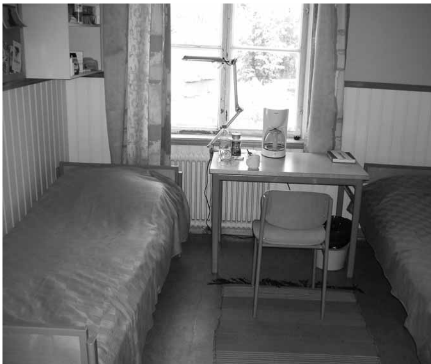
Ил. 1. Комната для заключенных в финской тюрьме Кеура. Фото автора (фотографирование было разрешено директором тюрьмы при условии, что в кадре не будет заключенных).

Обращает на себя внимание, что в новых финских тюрьмах даже закрытого типа, например в тюрьме Турку, на окнах в комнатах заключенных нет решеток (только очень прочное стекло), причем размер окна является обычным для жилых помещений. А в тюрьме открытого типа Кеура (Käyran Vankila), территория которой ничем не ограждена, ее сотрудник специально обратил мое внимание на то, что единственное помещение, где окна зарешечены, — это спортзал, а дома для заключенных были обычными, довольно комфортными деревянными коттеджами (Ил. 1).