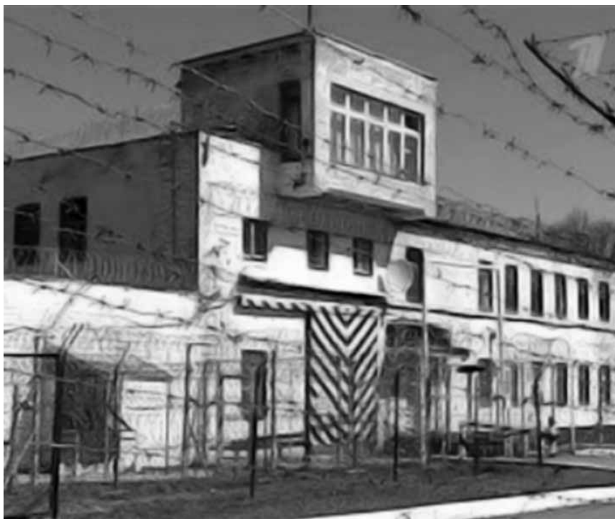
Ил. 4. Икшанская колония.

заклученного и берет пищу. Корреспондент или корреспондентка на фоне спиральных проволочных барьеров. Колючая проволока на фоне пламени (в репортажах о бунтах и пожарах в СИЗО и колониях). Сотрудники службы исполнения наказаний в военной форме с автоматами и собакой идут вдоль высокого забора с проволочным ограждением наверху.